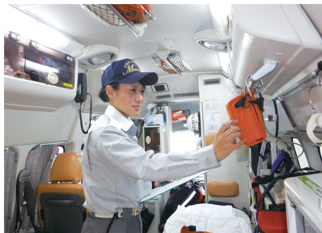
救急業務に従事する女性消防吏員

ワンデイ・インターンシップは、これから社会人となる年齢層の女性に、消防の仕事の魅力と消防分野での女性活躍の可能性を知ってもらい、消防を志す女性を増やすために、各消防本部と連携して実施するもので、189名の女性の参加者があった東京会場を皮切りに、全国8か所の会場で開催した(特集4-2図)。