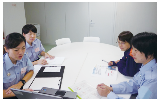
「さくら倶楽部」談話室での課題討議