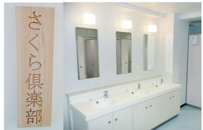
「さくら倶楽部」洗面所