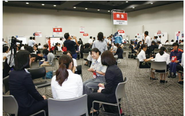
ワンデイ・インターンシップ（座談会）