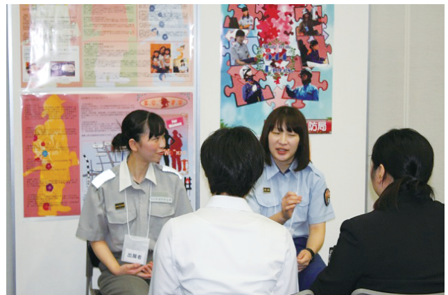
ワンデイ・インターンシップ（消防本部ブース）