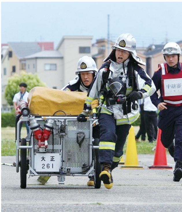
消防訓練中の女性消防吏員

また、消防長をはじめとした幹部職員に対して、女性の職域拡大、働きやすい環境の整備（イクボス（育児参加を理解して支援できる上司）などソフト面の環境整備も含む。）など、女性活躍推進に係る意識の改革・醸成等を目的とした講義を実施している。