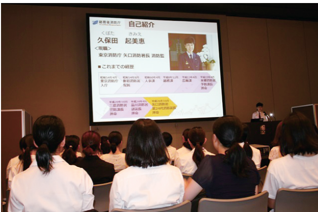
ワンデイ・インターンシップ（基調講演）

各会場では、消防士を目指すきっかけや、消火・救急・救助・火災予防等の各業種に関する経験等についての現役女性消防吏員による講演を行い、また、イベント参加者の疑問・不安に応えるため、ブースや座談会方式により、消防本部の組織や特徴等についての説明及び現役女性消防吏員との対話の機会を設け、様々な質問にもきめ細かく対応した。また、近隣の消防署にて執務室等の見学や消防車両の体験乗車、消防活動訓練の見学等を実施した。